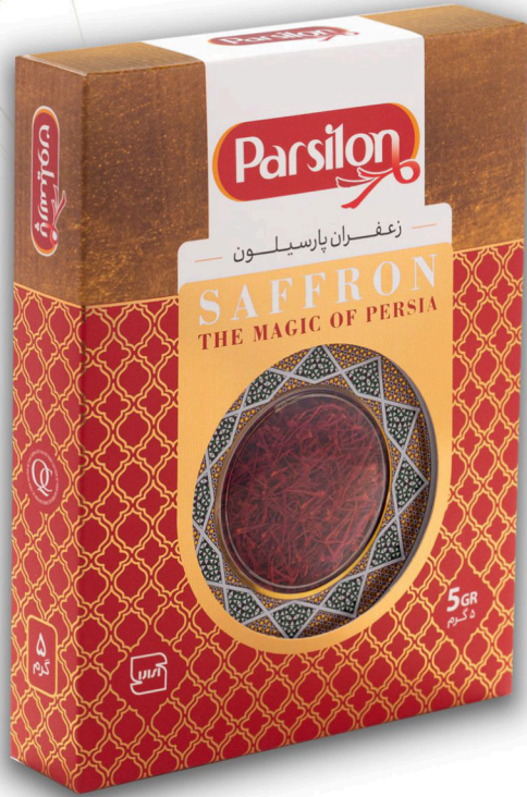
زعفران پنج گرم نگین با جعبه خاتم ابعاد جعبه ۳*۶/۶*۱۳/۷*۱۷/۷