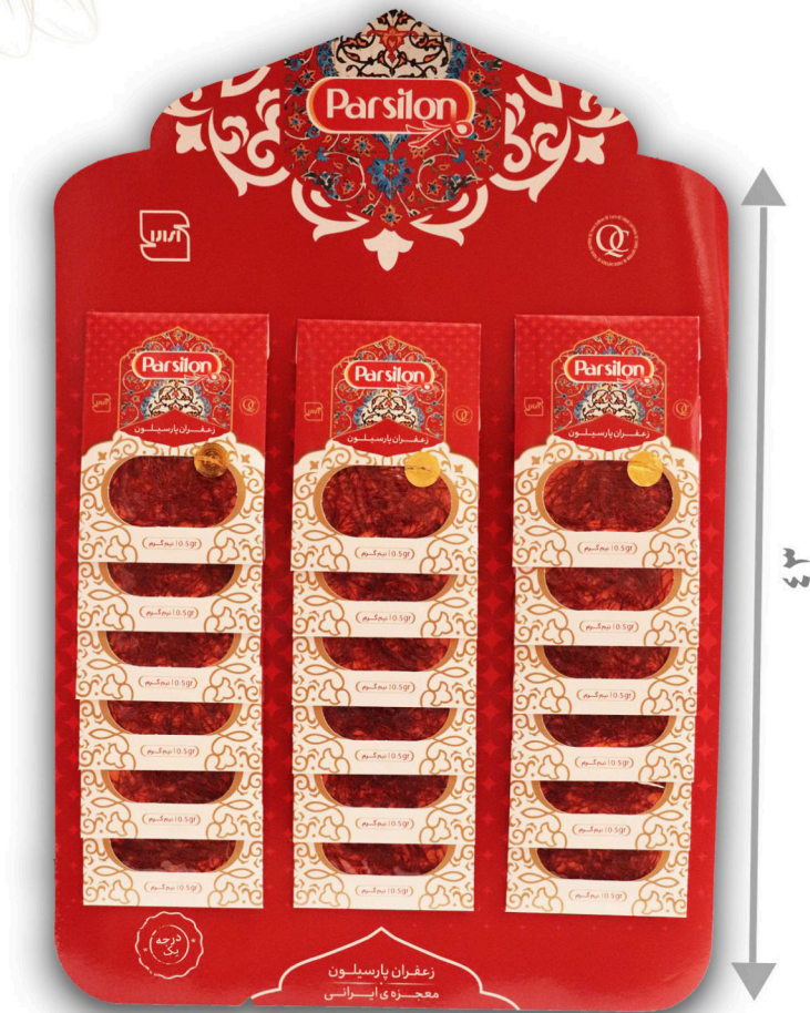
زعفران نیم گرم سرگل با بسته بندی آویز ۱۸ عددی