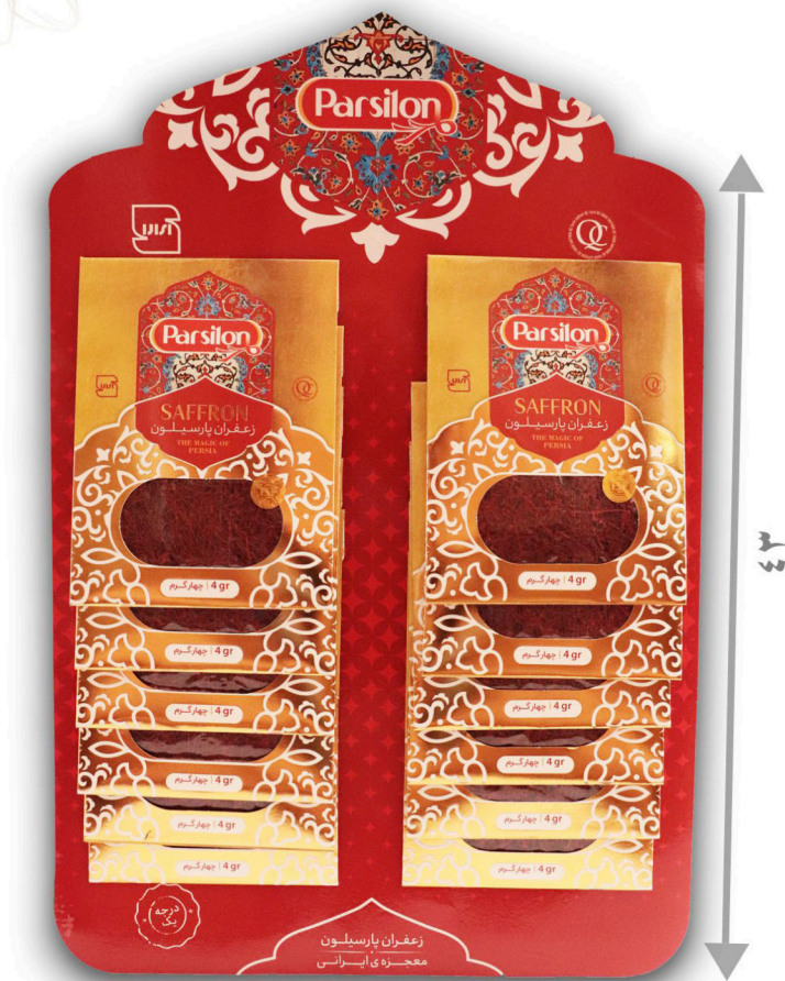
زعفران چهار گرم سرگل با بسته بندی آویز ۱۲ عددی