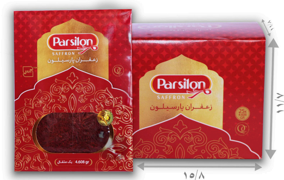
زعفران یک مثقال سرگل با بسته بندی پاکتی تعداد در یک ۲۵ عدد