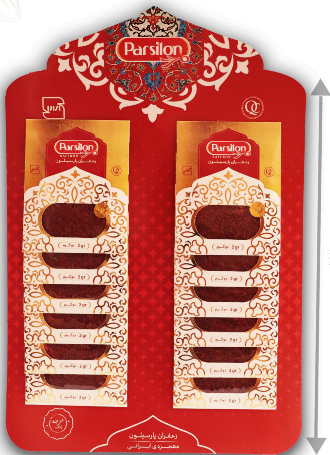
زعفران دو گرم سرگل با بسته بندی آویز ۱۲ عددی