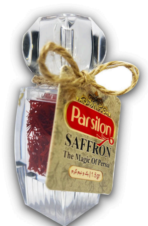
زعفران یک و نیم گرم نگین الماس