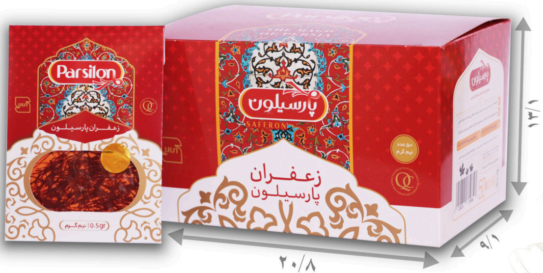
زعفران نیم گرم سرگل با بسته بندی پاکتی تعداد در پک ۵۰ عدد