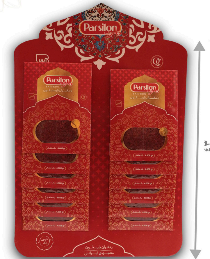
زعفران یک مثقال سرگل با بسته بندی آویز ۱۲ عددی