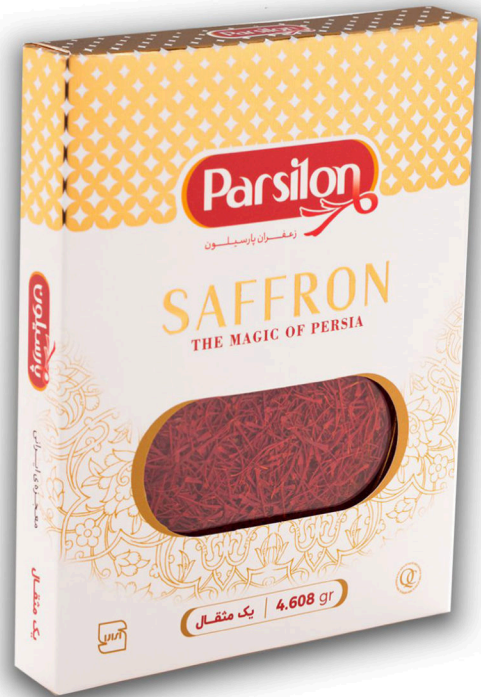
زعفران یک مثقال سرگل با جعبه هدیه ابعاد جعبه ۲/۲*۱۴*۱۷/۸