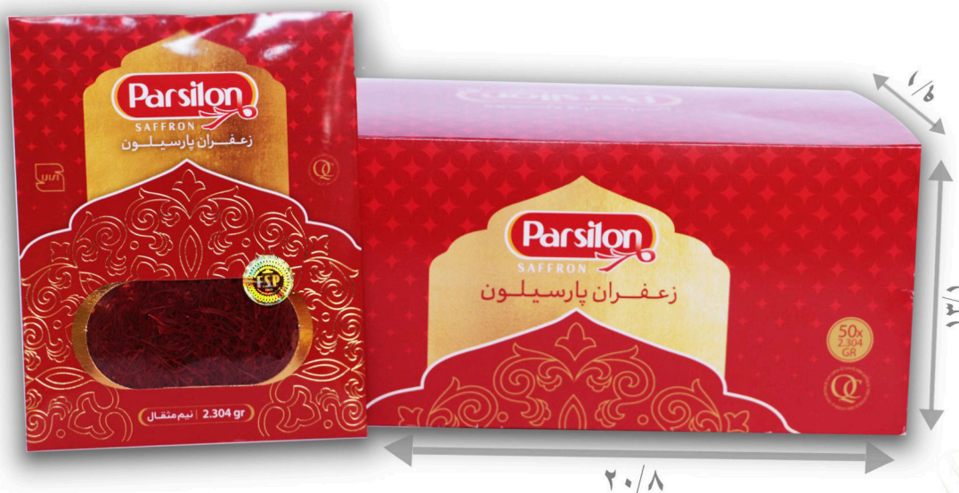
زعفران نیم مثقال سرگل با بسته بندی پاکتی تعداد در پک ۵۰ عدد