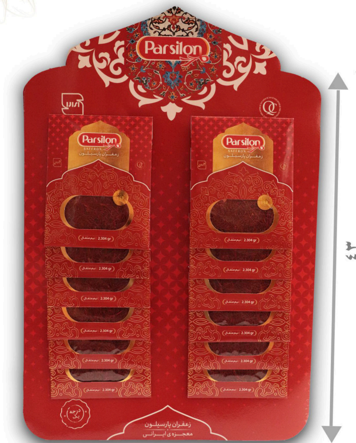
زعفران نیم مثقال سرگل با بسته بندی آویز ۱۲ عددی