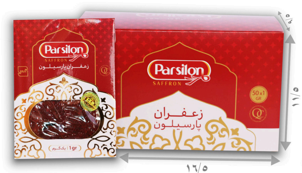
زعفران یک گرم سرگل با بسته بندی پاکتی تعداد در پک ۵۰ عدد