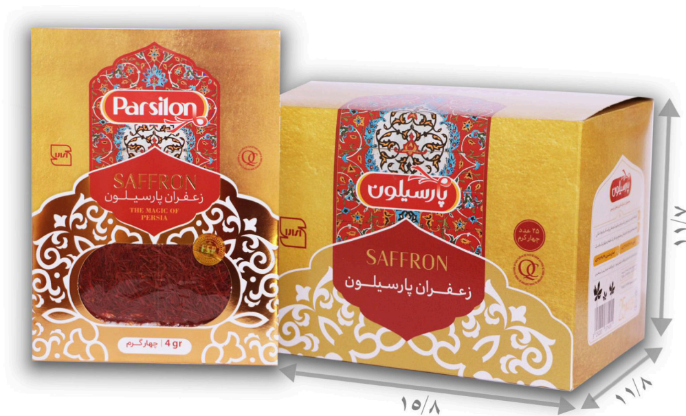
زعفران چهار گرم سرگل با بسته بندی پاکتی تعداد در پک ۲۵ عدد