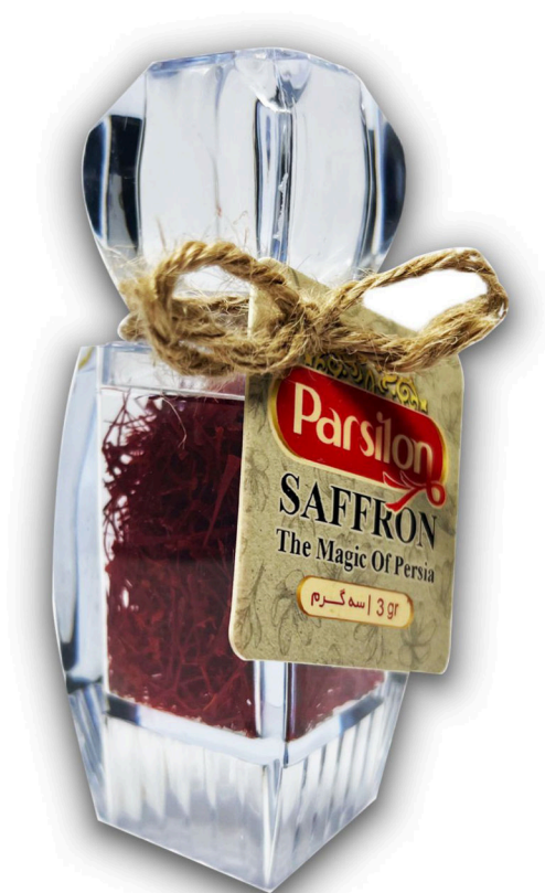
زعفران سه گرم نگین الماس