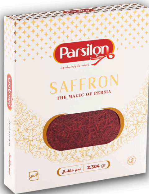
زعفران نیم مثقال سرگل با جعبه هدیه ابعاد جعبه ۲/۲*۱۳*۱۵/۷