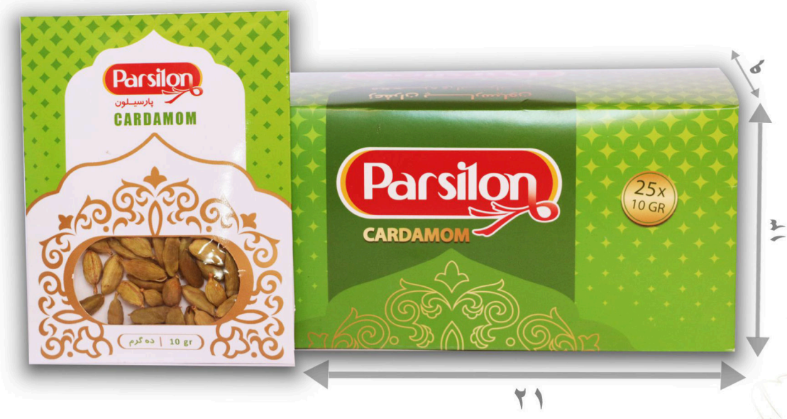
هل خالص ده گرم با بسته بندی آویز ۱۰ عددی