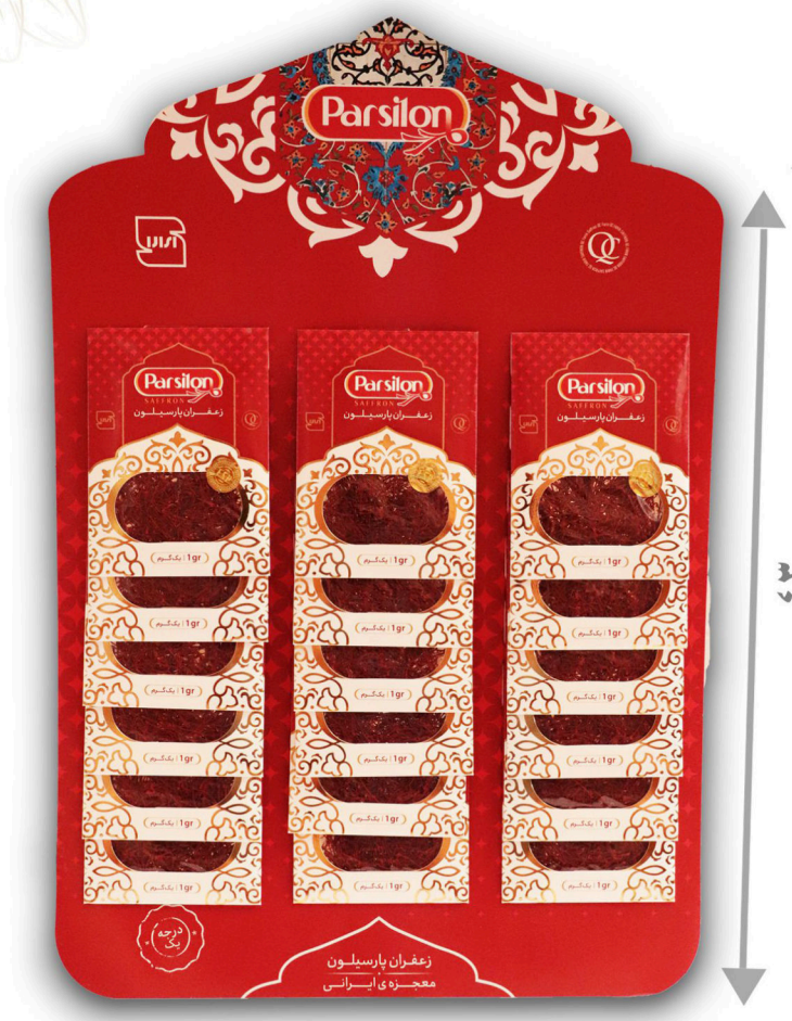
زعفران یک گرم سرگل با بسته بندی آویز ۱۸ عددی