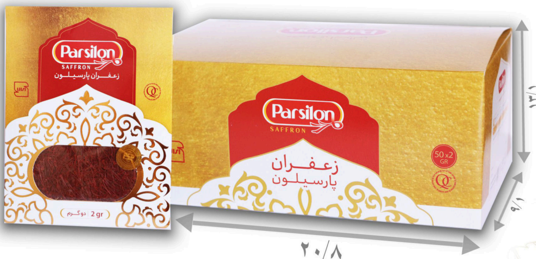
زعفران دو گرم سرگل با بسته بندی پاکتی تعداد در پک ۵۰ عدد